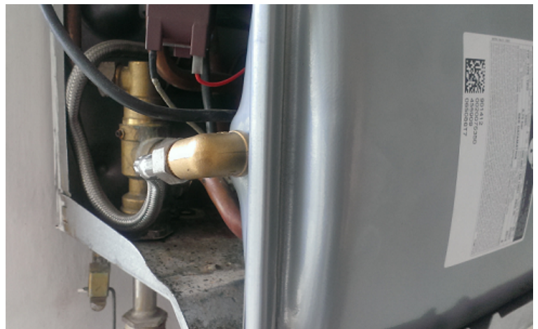
Obr. Expanzní nádoba po výměně