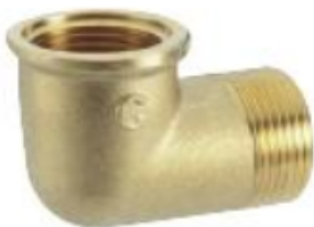
Obr. Koleno 3/8" MF

Při výměně expanzní nádoby je nutné použít i díl „Koleno 3/8" MF“, které je běžně dostupné u prodejců s vodoinstalačním materiálem. Před montáží kolena 3/8" MF na expanzní nádobu je nutné použít závitové těsnění, které se aplikuje na závitový spoj expanzní nádoby. Doporučujeme provést výměnu i těsnění 14,3x8,0x1,6, které je v nabídce náhradních dílů pod objednacím číslem 87381026150 (po 10ks).